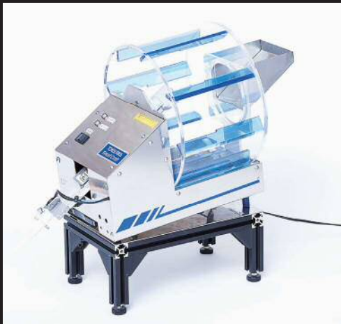
絡みついたコイルバネをほぐす