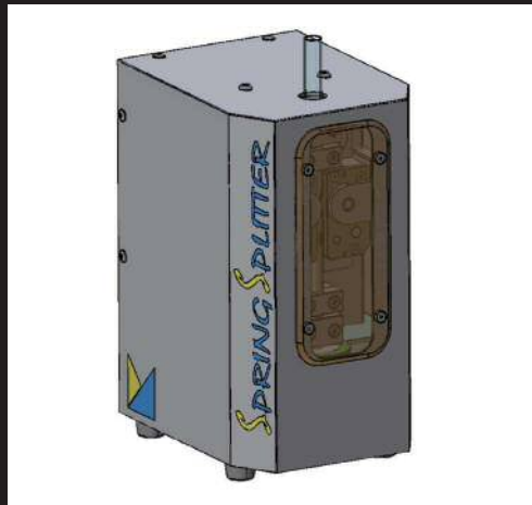
コイルバネを切り離して送る